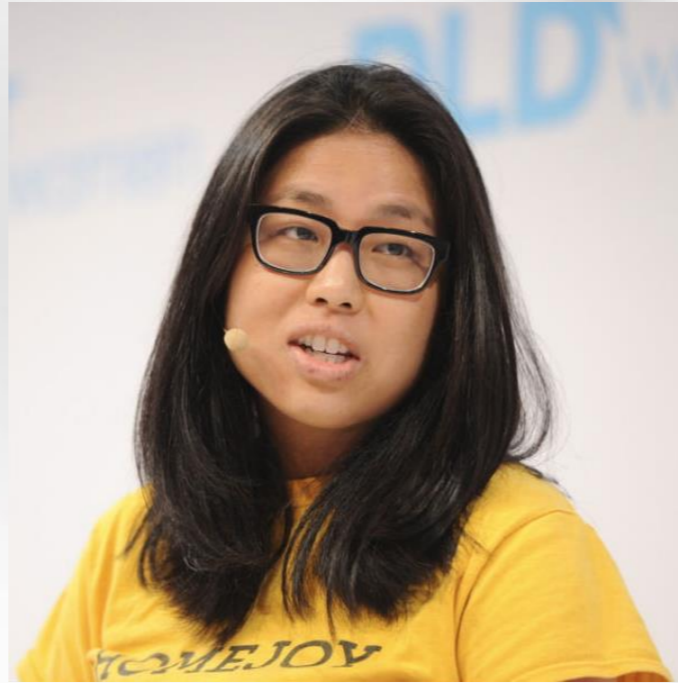
頂尖創業加速器Y Combinator 合夥人Adora Cheung