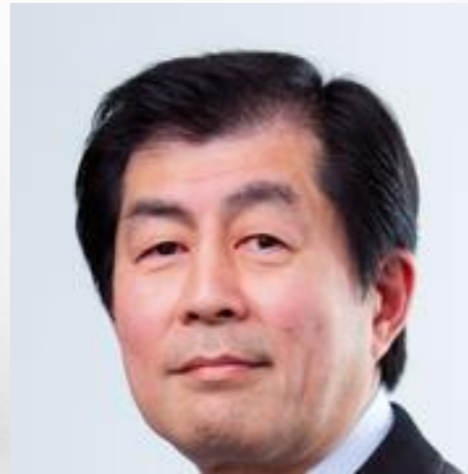
東京大學i-school創辦人 Hideyuki HORII