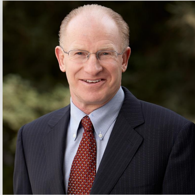
CyberKnife發明者Dr. John R. Adler